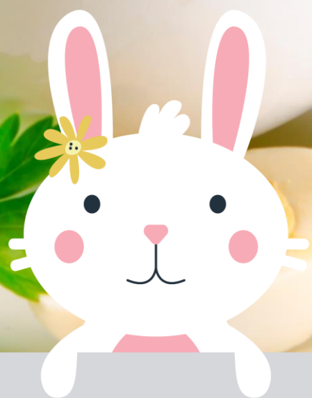
ŻUR Z JAJKIEM