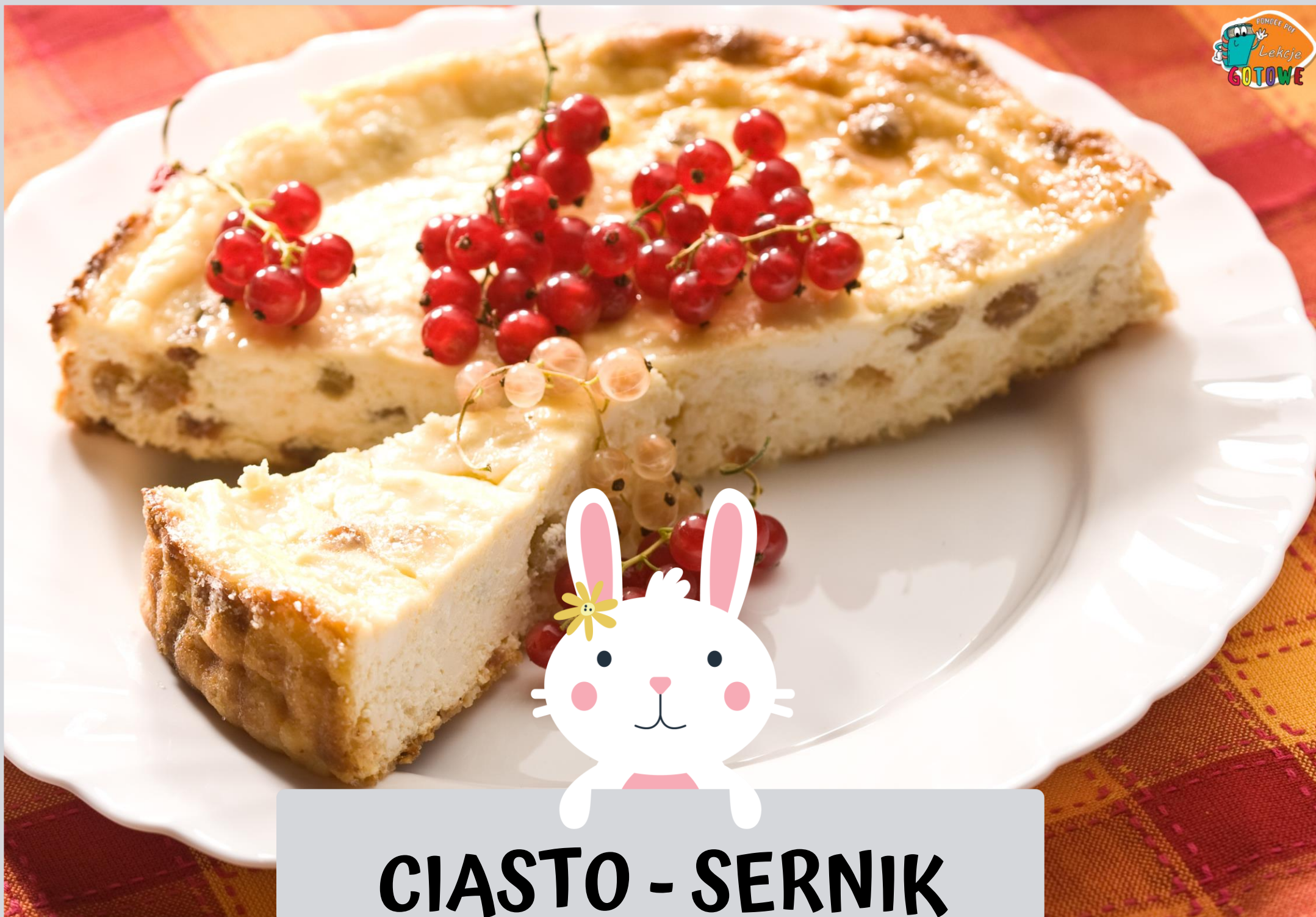
CIASTO - SERNIK